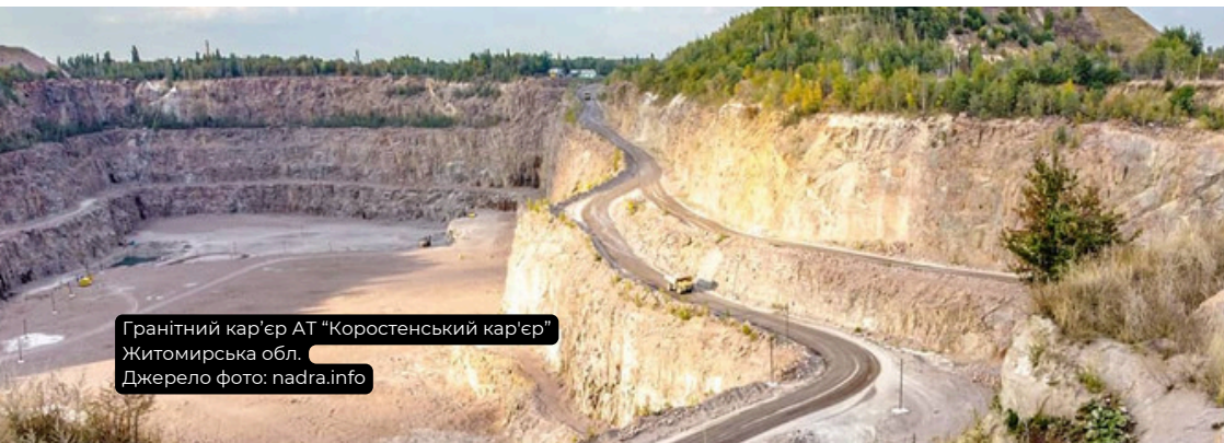
Гранітний кар'єр АТ "Коростенський кар'єр" Житомирська обл.

5 Також підприємства інколи успішно поновлюють зупинені дозволи . Станом на 29.04.2024 - поновлено 2 спецдозволи (ТОВ "Межиріченський ГЗК", ПАТ "Коростишівський кар'єр").